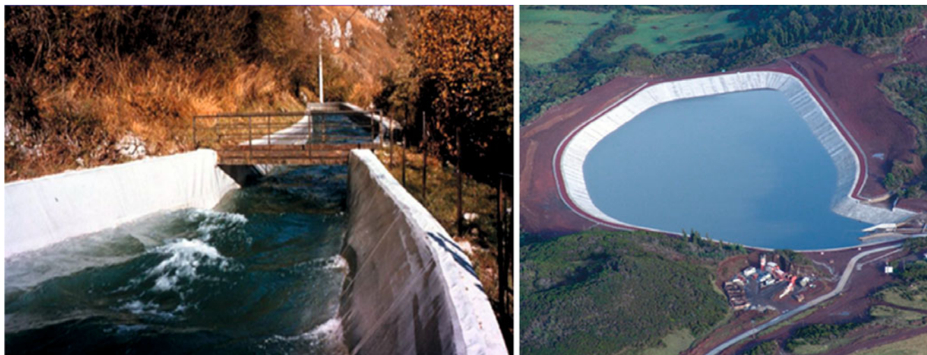
Рис. 1. Эксплуатируемые гидротехнические сооружения с гидроизоляционным ПФЭ, содержащим ГСМ

Геосинтетические материалы в составе конструкций элементов грунтовых сооружений испытывают ряд различных нагрузок и разрушающих факторов как в период строительства, так и в период эксплуатации. К основным нагрузкам на геосинтетические материалы можно отнести нагрузки, приводящие к деформации материала, к которым можно отнести нагрузки от внешнего давления на ГСМ (столба воды, грунта, транспортных средств и др.), сдвиговые нагрузки, а также длительные факторы воздействия (облучение ультрафиолетом, естественное старение, повторяющиеся циклы сезонного замораживания и оттаивания) (рис. 1). Поэтому необходимо учитывать перечисленные выше факторы при выборе геосинтетических материалов для грунтовой строительной конструкции, а, следовательно, и обоснованно задавать исходные данные для проектируемых объектов.